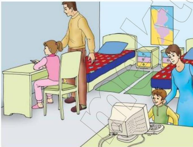
Le Français ... un pas de plus 5B Module 1 Situation 3- Planche 3-d

Les deux enfants accrochent les habits puis ils rangent les jouets dans la boîte à jouets puis ils plient et rangent les vêtements dans l'armoire .