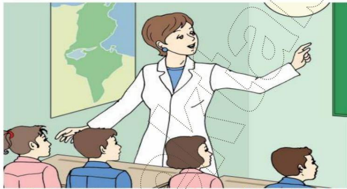
Le Français ... un pas de plus 5B Module 1 Situation -1- Planche -1-b-

Le directeur de l'école : « Notre école organise un concours de la plus belle salle de classe .On va voir quelle classe va gagner le premier prix , allez , au travail tout le monde !... »