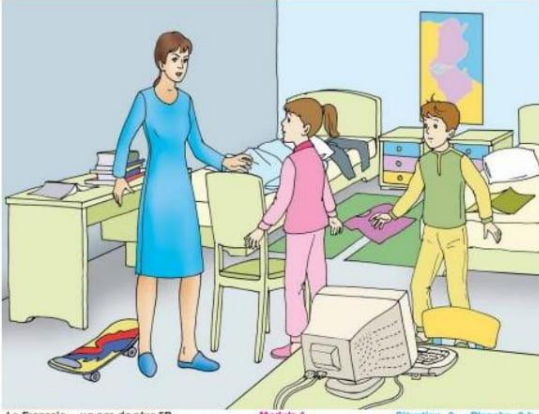
Le Français ... un pas de plus 5B Module 1 Situation 3- Planche 3-b

La mère est surprise . Elle est très fâchées , elle gronde ses enfants et leur demande de ranger leur chambre immédiatement .