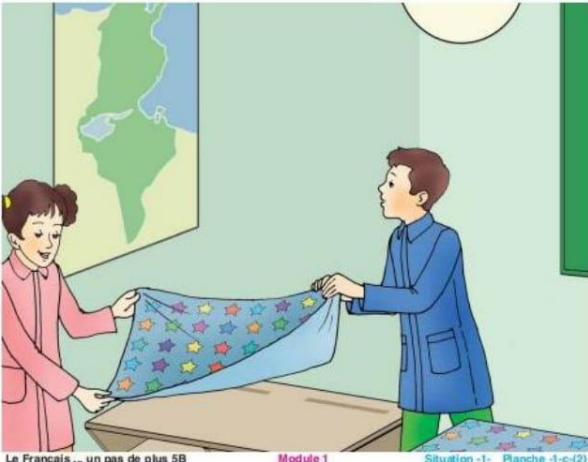
Le Français ... un pas de plus 5B Module 1 Situation -1- Planche -1-c-(2)

Ils couvrent les tables avec de jolies nappes multicolores .