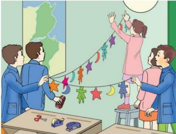
Le Français ... un pas de plus 5B Module 1 Situation-1- Planche-1-c(5)

Monte sur une chaise et elle accroche les guirlandes . .