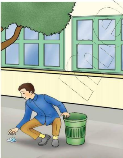
Le Français ... un pas de plus 5B Module 1 Situation -1- Planche -1-c-(4)