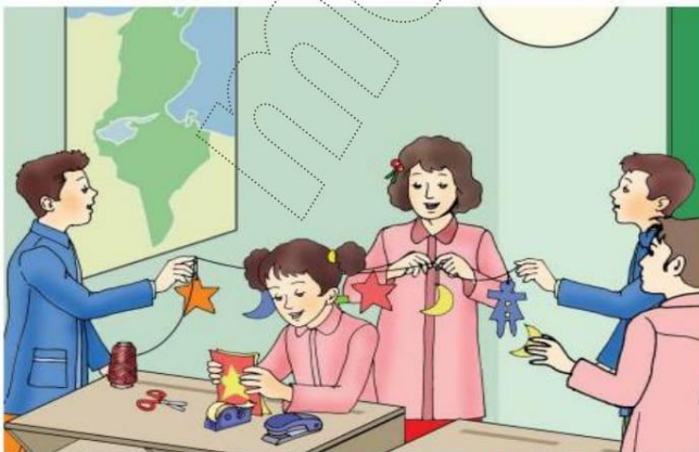
Le Français ... un pas de plus 5B Module 1 Situation -1- Planche -1-c(1)

« Que pensez vous de notre classe ? Est-elle propre ? Est-elle belle ? Vous vous avoir la plus belle classe de l'école ? Si vous êtes d'accord , Que proposez- vous de faire ? »