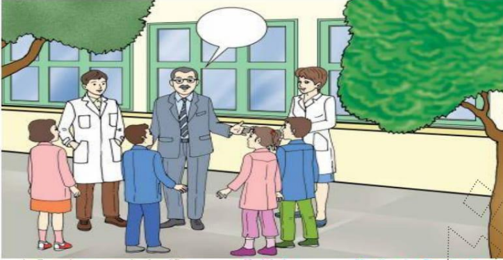
Le Français ... un pas de plus 5B Module 1 Situation -1- Planche -1-a-

Quinze jours après la rentrée scolaire , le directeur de l'école annonce qu'il lance le concours de la plus belle salle de classe . Voila ce qu'on fait les élèves de la 5 ème année.