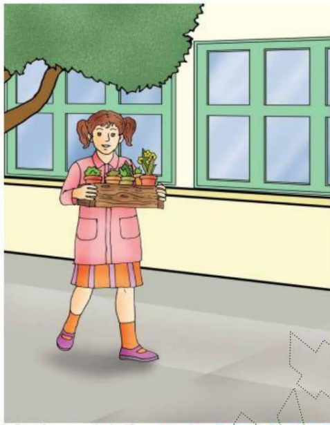
Le Français ... un pas de plus 5B Module 1 Situation -1- Planche -1-c-(3)

Ils couvrent les tables avec de jolies nappes multicolores .