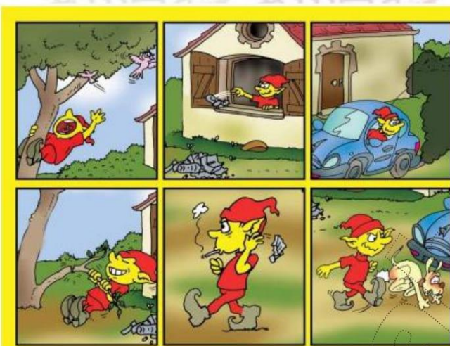
Le Français ... un pas de plus 5B Module 1 Situation 2

Monte sur une chaise et elle accroche les guirlandes . .