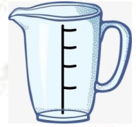
مكيال 1 لتر

مثال يستعمل اللبان مكيال اللتر في قيس سعات الحليب .