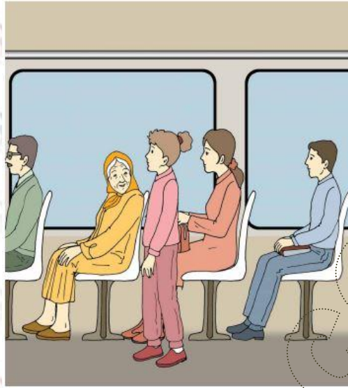
Le Français ... un pas de plus SB Module 3 Situation -1- Planche -1-b-(2)

Alors elle décide de lui céder sa place en lui disant : " Oui, bien sûr. Ne restez pas debout madame .Venez vous asseoir "