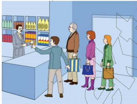
Le Français ... un pas de plus SB Module 3 Situation -1- Planche -1-c-

Monsieur Hedi est au supermarché . Il attend son tour pour acheter des produits de nettoyages .Tout à coup un client arrive et veut passer avant lui .