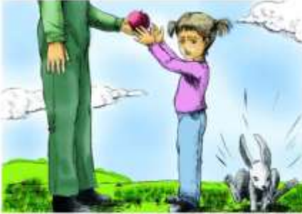
Le Français ... page à page 38 Module 10 J7 -2