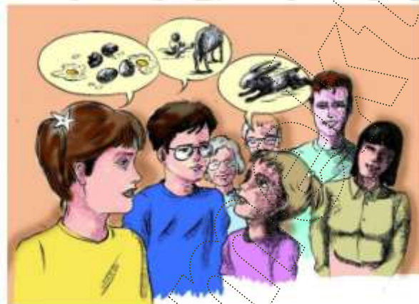
Le Français ... page à page 38 Module 10 J7 -4

Nadine court après le lapin en pleurant .