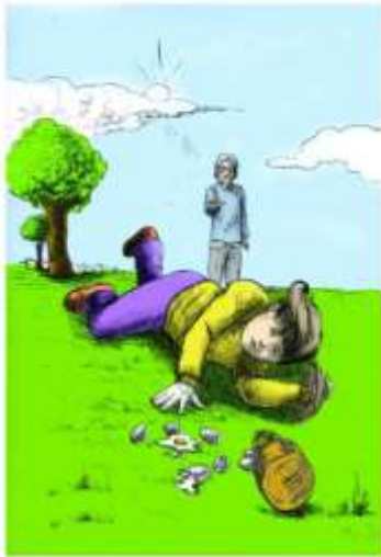
Le Français ... page à page 38

Amélie dit : « Regarde grand-mère ! j'ai ramassé beaucoup des œufs ! » « Bravo ma petite . » Répond grand- mère .