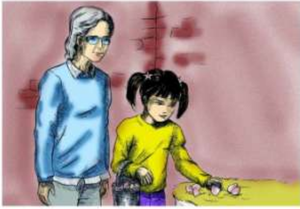
Le Français ... page à page 38