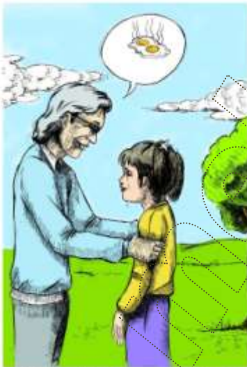
Le Français ... page à page 38

En rentrant Amélie tombe et casse les œufs .