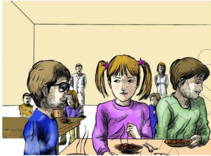
Le Français ... un pas de plus 3B