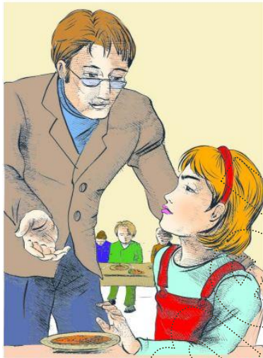
Le Français ... un pas de plus 3B

Les enfants mangent de la viande et des pâtes.