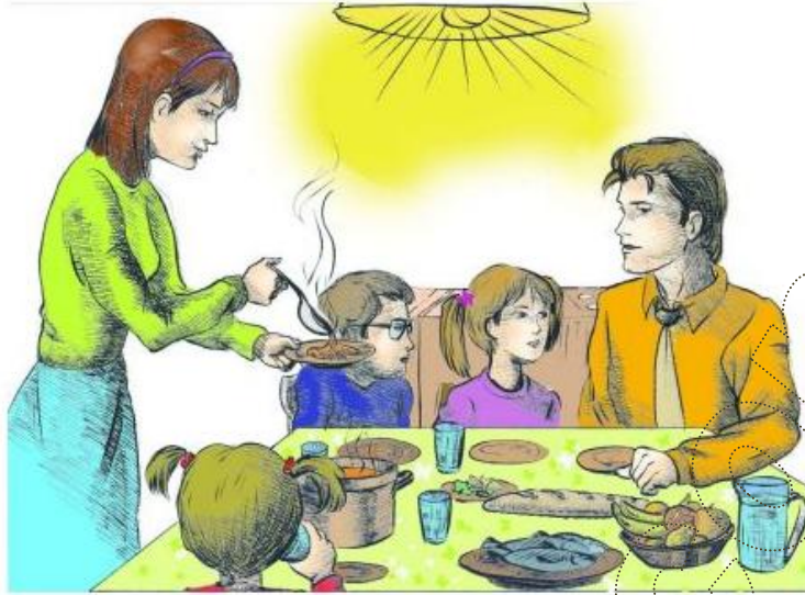
Le Français ... un pas de plus 3B