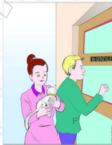
MOPULE 9 - Journée 5 , P3

Le chat s'est endormi dans la voiture des voisins qui partent au travail le matin et ne rentrent que le soir. Les voisins s'aperçoivent que le chat est dans leur voiture.