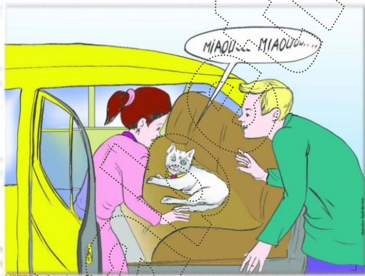
MOPULE 9 - Journée 5 , P2

La maîtresse et les camarades décident d'aider Pablo à retrouver son chat dès la fin des cours.