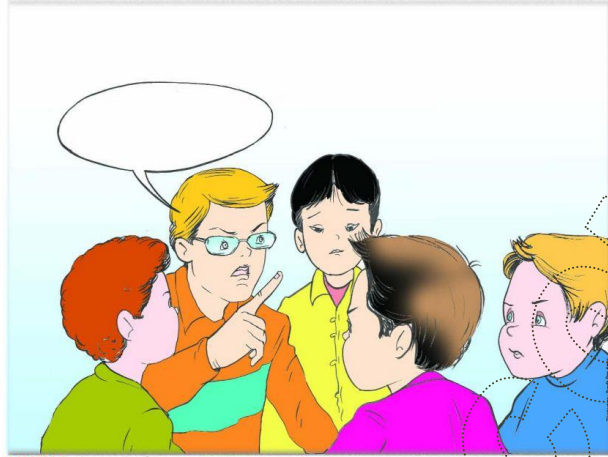
MOPULE 9 - Journée 2 , P3

Et il dit : « Pourquoi vous lui arrachez son cartables ? Laissez le tranquille ! il est nouveau au collège, il ne parle pas bien le français ! » Les garçons répondent : « Cet étranger est un nouvel élève . Il a les yeux bridés et la peau jaune . » L'élève s'éloigne d'eux , la tête baissée en pleurant doucement . Il a l'air malheureux et triste . A ce moment là j'interviens en disant : « Pourquoi faites des maladresses et des misères à ce gentil ? c'est injuste ce que vous faite ! Nous sommes tous égaux , quelles que soient nos différences !... »