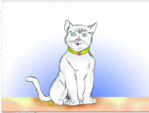
MOPULE 9 - Journée 5 , P1

Cet après-midi, Pablo arrive à l'école, les yeux tout rouges, il a beaucoup pleuré. Son meilleur ami, son chat «Kiwi» a disparu depuis le matin .