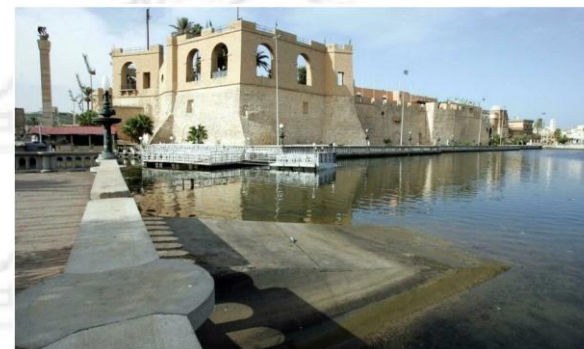
Musée national de Tripoli .