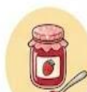
de la confiture