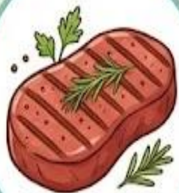
de la viande